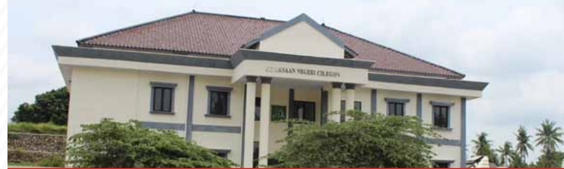
Gedung Kejari Cilegon

Awalnya kami mencoba ke Batching plant lain hasil dan pelayanan kurang memuaskan dan kami beralih ke bangun beton selain armada yang bermacam dan alat pendukung yang fresh membantu pekerjaan kami dilapangan pelayanan yang ramah , cepat dan tidak ribet sangat membuat kami nyaman