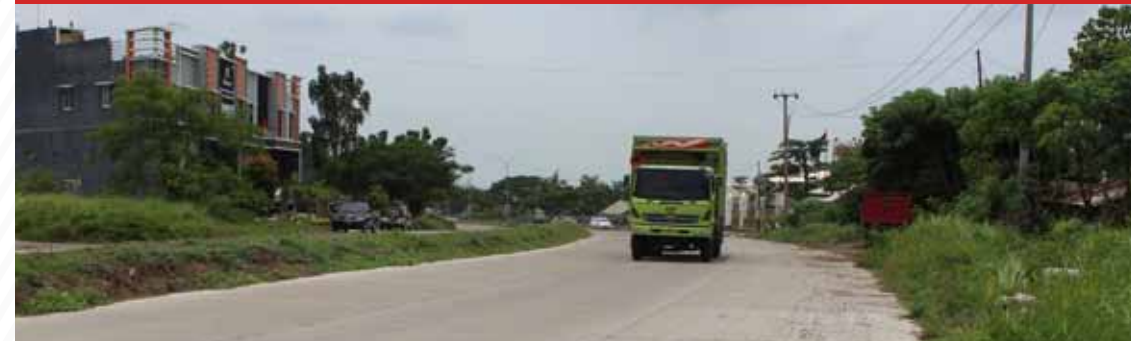
Jalan Lingkar Selatan Cilegon